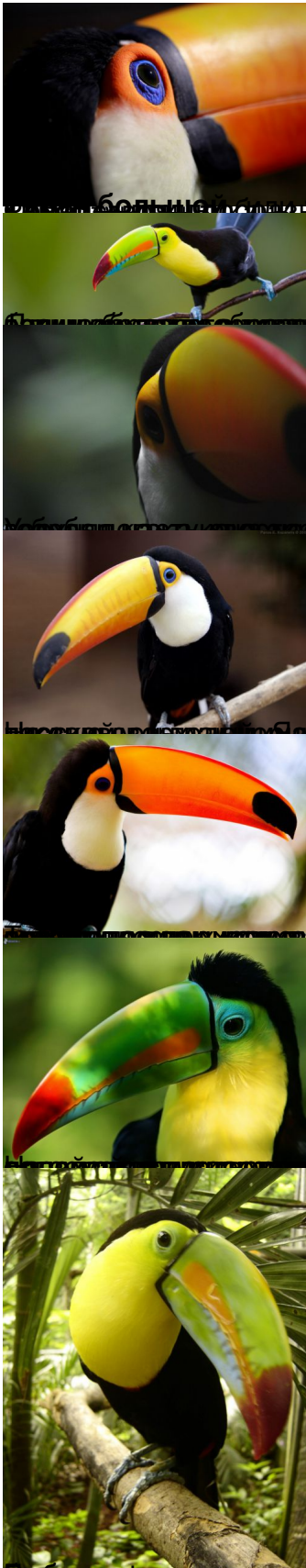
Токко ( Ramphastos toco )

Токко - самый большой и самый распространенный вид семейства в Южной Америке. Самый большой вид семейства.